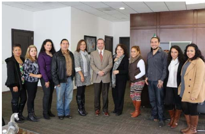
Se puso en marcha el primer curso- taller de Promoción de Salud de la Población Migrante.

ZACATECAS, ZAC.- Raúl Estrada Day, secretario de Salud de Zacatecas (SSZ), puso en marcha el primer curso- taller de Promoción de Salud de la Población Migrante con la participación de los auxiliares en la materia, de los Estados Unidos de América (EUA).