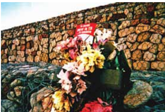
¡Yo Puedo Tu también! - Hilda, Participante de Fotovoz