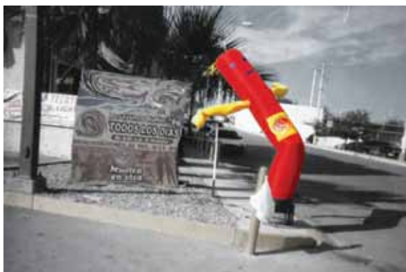
Noches de Invierno-Ahinoam, Participante de Fotovoz

"Cuando iba al trabajo con mis compañeros, vi al muñeco de aire que se caía y se levantaba. Así me sentía yo cuando tenía tuberculosis. Con el frío la enfermedad aumentaba y caía en cama. Me ponía vitaminas y antibióticos y volvía a levantarme.