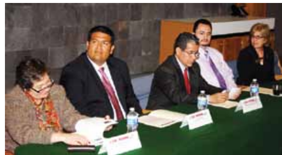
Inauguración de la galería de FotoVoz en el consulado mexicano de El Paso Tx.