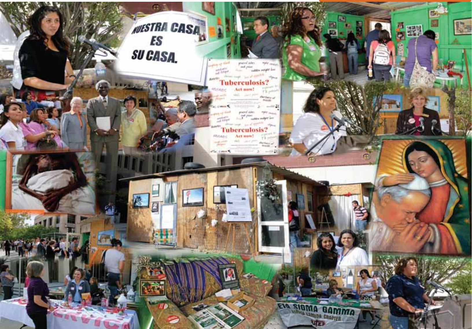
Nuestra Casa: Exhibición tridimensional sobre tuberculosis UTEP, Octubre 2009