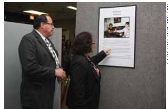
Galería de Voces e Imágenes- Participantes de Fotovoz

Diez de los participantes tenían o tienen un familiar (en algunos casos más de uno) con tuberculosis. En ciertos casos, sus parientes habían muerto a causa de la tuberculosis. Todos los participantes reportaron retraso de varios meses en la búsqueda de tratamiento (hasta 24 meses) entre la aparición de los síntomas y el inicio del tratamiento de la tuberculosis en las dos ciudades del estudio.