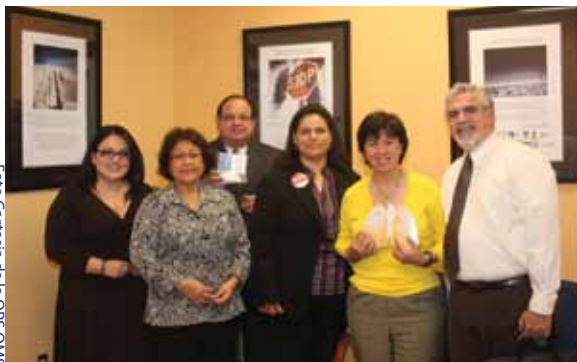
Día Mundial de la TB Exhibición de Voces e Imágenes

Fotovoz dió a los participantes la oportunidad de comunicar sus pensamientos y sentimientos a los demás dentro de un ambiente de grupo emocionalmente seguro. Lo hicieron a través de un método participativo de diálogo, selección de fotografías donde se reflejaban sus preocupaciones y perspectivas sobre la tuberculosis, y sus comunidades para poner el tema a discusión. Ellos contextualizaron y contaron historias y luego identificaron los problemas y temas que surgieron. Adicionalmente compartieron sus reflexiones con el grupo y definieron el significado de sus imágenes utilizando la técnica de SHOWeD (Wallerstein, 1994).