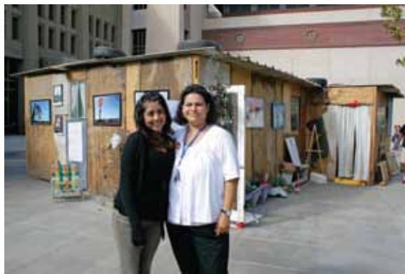
Exhibición "Nuestra Casa" en UTEP

La confidencialidad en la prestación de servicios, la información precisa y la orientación a PATB y familiares sobre la enfermedad, se señaló como una de las acciones más importantes que los trabajadores de salud pueden adoptar para mitigar la discriminación. Los participantes indicaron que ninguna persona debe ser tratada de manera injusta. Y consideraron que una vez que una persona ha sido discriminada por personal de salud, no había nada que se pudiera hacer.