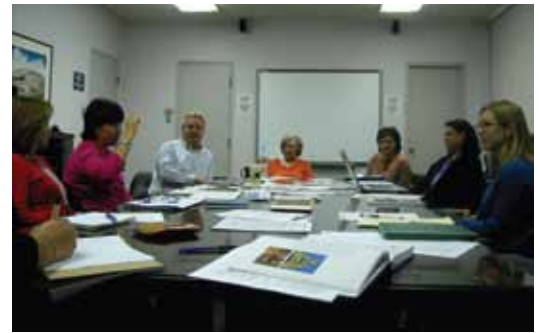
Comité Asesor de Voces e Imágenes

Los miembros del comité actuaron como «guardianes» del proyecto, facilitando el acceso a personas influyentes y organizaciones.