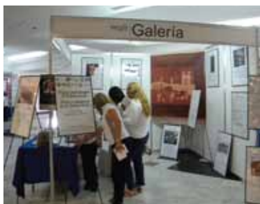
Galería de Voces e Imágenes en la Conferencia Internacional de TB