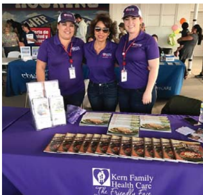
Feria de Salud en Kern Country, California

Las actividades incluyen ferias de salud, conferencias, talleres educativos, torneos deportivos y eventos culturales, en donde la información de salud y los servicios médicos son proveídos en una manera cultural y lingüísticamente apropiada. Los eventos se organizaron en lugares donde la población latina se siente cómoda y segura. La SBS también facilitó que diversos consulados Latinoamericanos se unieran y realizaran eventos conjuntos. Información y servicios de salud se incorporan a actividades culturales y festividades latinas, integrando música, bailes y comida típica, como una manera de celebrar la salud y celebrar la vida.