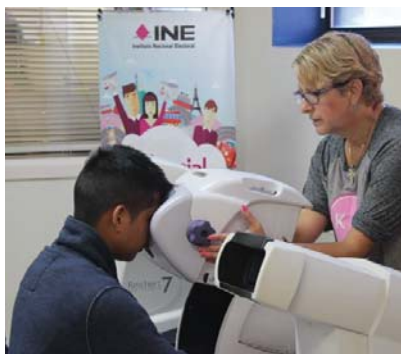
Examen de vista en Kansas City, Missouri