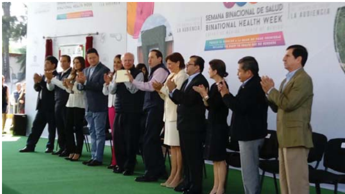
El evento inaugural de la XVI SBS en Tonalico, México.