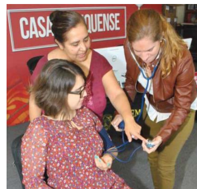
Prueba de presión arterial en Chicago, Illinois