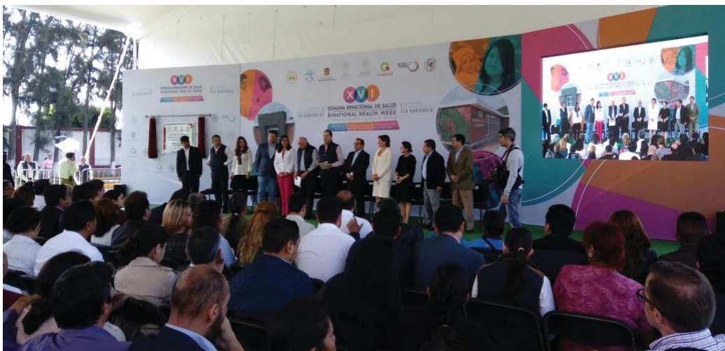
El evento inaugural de la XVI SBS en Tonalico, México.

Bajo el lema “Porque el Derecho a la Salud no tiene Fronteras” se celebró la XVI Semana Binacional de Salud (SBS). Este esfuerzo anual que se realiza durante el mes de octubre en los Estados Unidos y Canadá, tiene como objetivo brindar información y servicios de salud a la población de origen latino más desprotegida. Desde el 2001, bajo la coordinación de las Secretarías de Salud y Relaciones Exteriores de México, los Ministerios de Relaciones Exteriores de Guatemala, Honduras, Colombia y Perú, y el apoyo de la Iniciativa de Salud de las Américas, de la Universidad de California en Berkeley, se organizan miles de actividades de salud a lo largo del país, incluyendo exámenes básicos de detección gratuitos, vacunaciones, pláticas informativas, talleres, referencias a servicios médicos y sociales, foros y eventos deportivos.