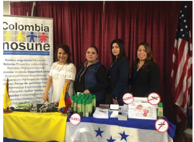
Mesa de información sobre el virus de Zika en Miami, Florida

Igualmente, se ofreció capacitación a los coordinadores de la SBS y a las agencias con quienes ellos trabajan; sobre temas de actualidad en salud, que afectan de manera particular a la población latina. En el 2016, gracias a la colaboración de La Red Hispana de Comunicaciones, se realizó una presentación vía internet (webinar) sobre las pruebas de VIH y el Día Nacional Latino para la Concientización del SIDA. También, con el apoyo de los Centros de Control y Prevención de Enfermedades (CDC) se llevó a cabo una videoconferencia en español sobre el Virus del Zika y cómo proteger a las comunidades latinas en los EEUU.